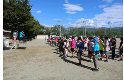
(大国地区子どもクラブ指導者協議会)