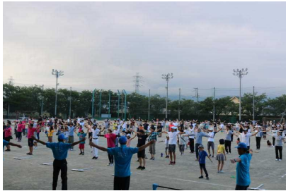
(大国地区子どもクラブ指導者協議会)