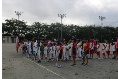
(大国地区子どもクラブ指導者協議会)